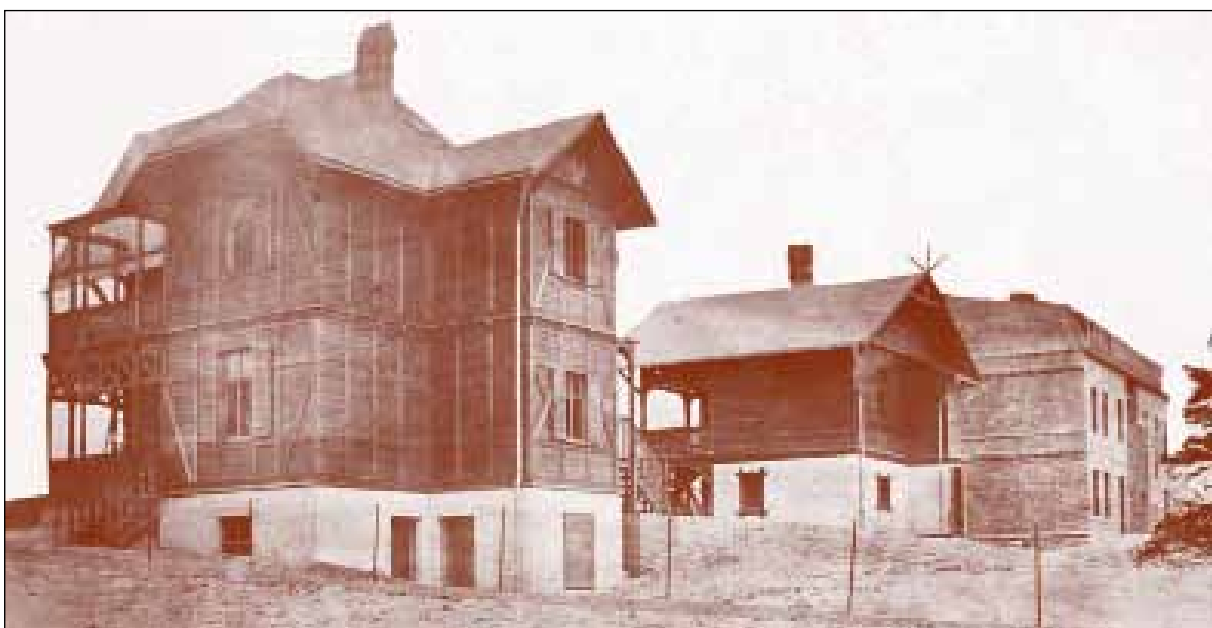
Die Rückseiten der beiden Villen. 45

Mit Knickebockas, Schlips un Kragen Leg Krause unner sinen Wagen Un bloß die Bein`n keken rut O geh`wo seh`ch uns Dr. ut!