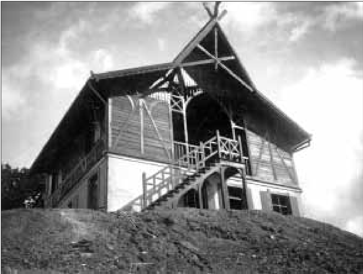
Das Drachenhaus kurz nach der Fertigstellung. 166/167

Von keinem anderen Wolgaster Holzhaus und seiner Umgebung gibt es so viele detailierte Schilderungen wie vom Drachenhaus. Da das Gebäude über Generationen die Wir-