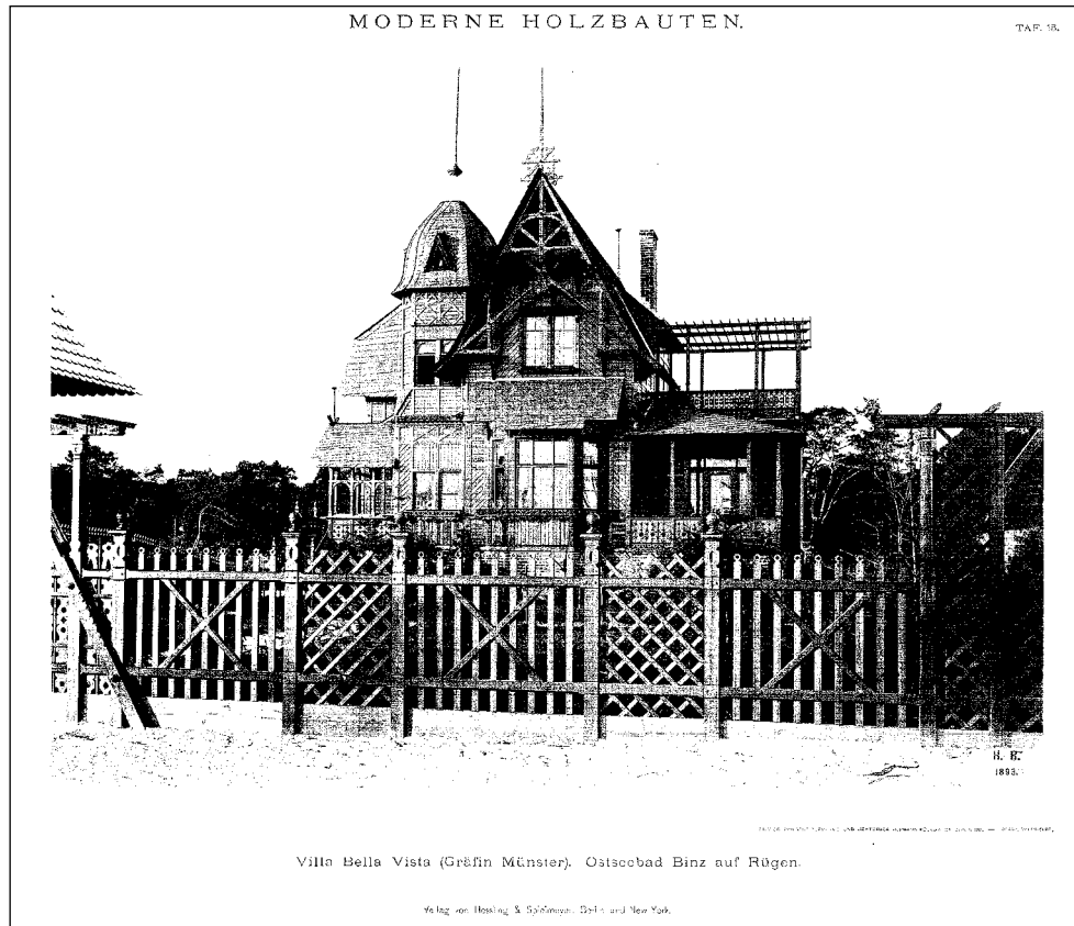
Die Villa Bella Vista. 106

Schon vor 1893 errichtete die Wolgaster Actien-Gesellschaft für Holzbearbeitung an der Strandpromenade von Binz die Villa Bella Vista für die Gräfin Münster.