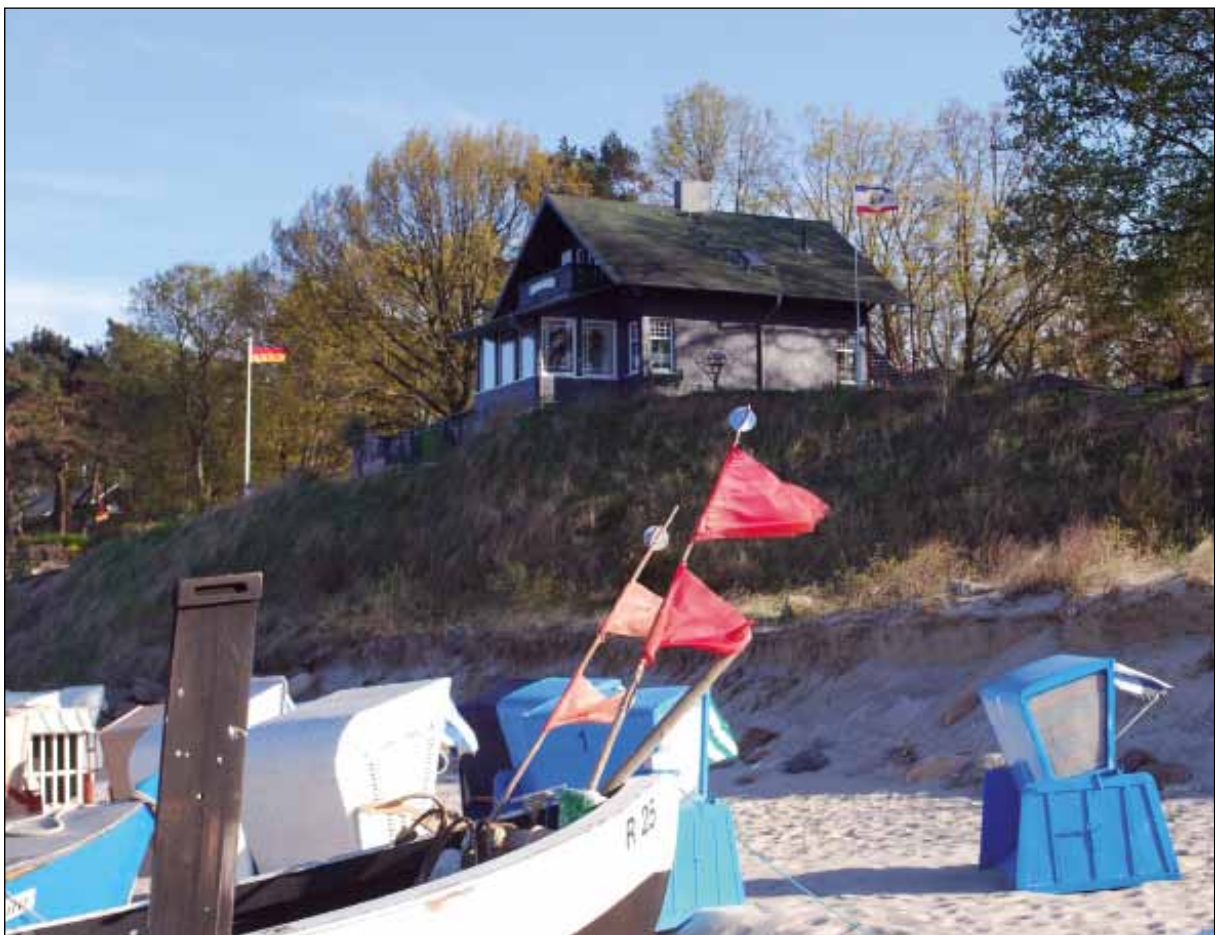
Das Gebäude im Jahre 2011. 66

wohl kaum einen schöneren Ort als die Villa am Steilufer von Stubbenfelde.