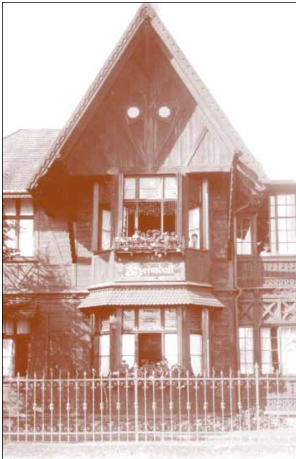
Die Promenadenansicht der fertig gestellten Villa und ihre Gäste. 46

Herr Dr. Krause in Bansin Wirkt mang sin Jod un`Penzelin Un` Christa ohn sich tau genießen Is wedder dull bi ehr Massieren.