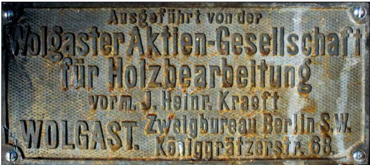
Die Originaltafel der Wolgaster Actien-Gesellschaft für Holzbearbeitung. 65

dem er den Hang befestigt sowie dessen Sockel mit großen Felssteinen schützt. Zeigt die Natur dann aber ihr friedliches Gesicht, gibt es